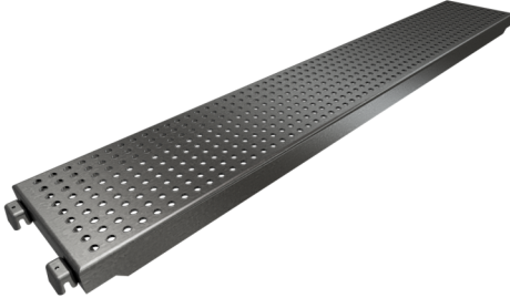
Planche de système en acier, Longueur: 2000 mm

Numéro d'article / Article number: 103220